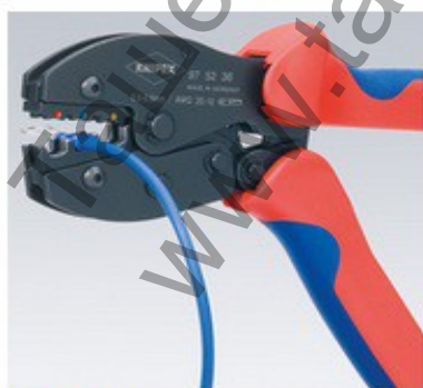
97 52 36

За ежедневните приложения на кримпване специалистът иска кримп клещи, които да работят надеждно и прецизно. Освен това те трябва бъдат леки, удобни, издържливи и евтини: PreciForce®.