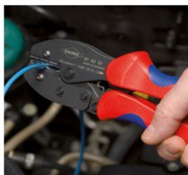
97 52 37